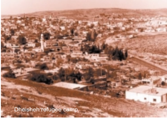
Dheisheh refugee camp