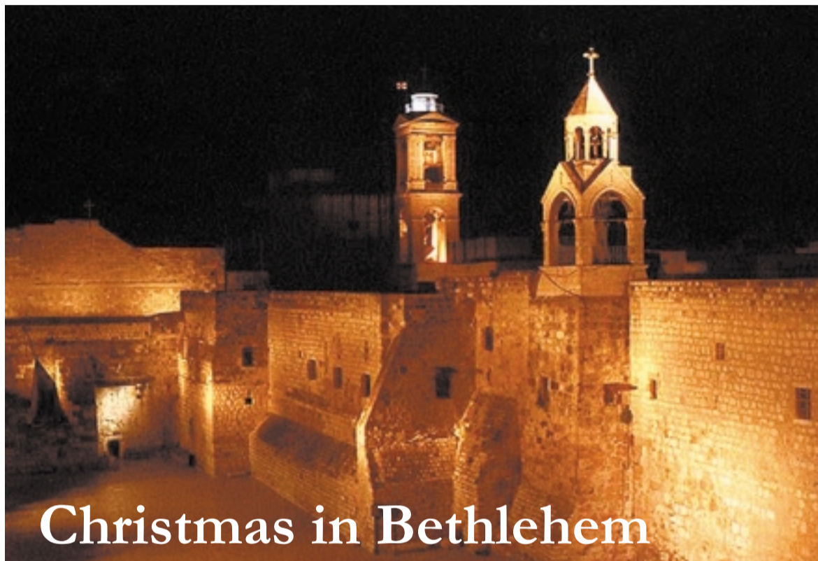
Christmas in Bethlehem