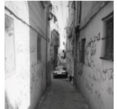
Photo by: Basil Zboun, 15, a refugee from Aida refugee camp, Bethlehem